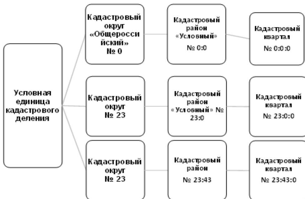
Рисунок 2.1 – Кадастровое деление в РФ