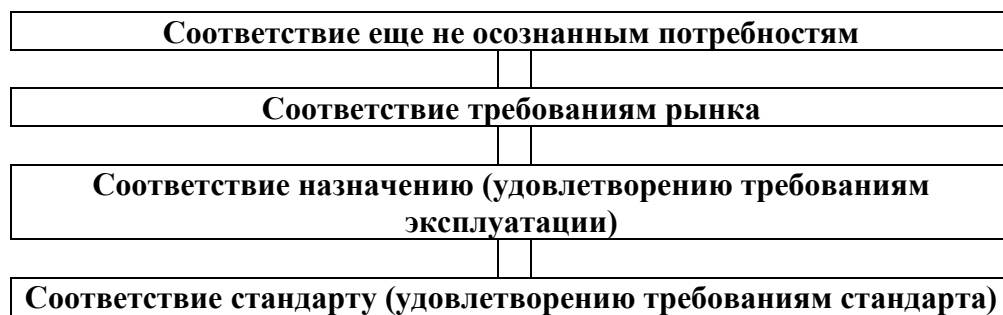
Рисунок – Японская четырехуровневая иерархия качества

Четырехуровневая иерархия качества представлена на рисунке.